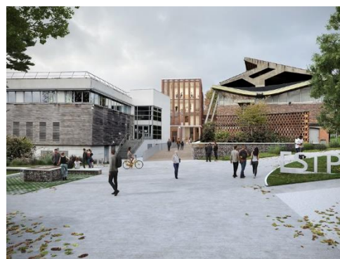
© Thibaut Robert Architectes & Associés

Le projet totalise plusieurs surfaces nouvelles dont la construction d'un bâtiment « La Fabrique » dédié à la recherche et le « gymnase » issu de la reconversion d'un ancien bâtiment. Pour les éléments verticaux de « la Fabrique », plus de 70 % des bétons mis en œuvre utilisent un ciment CEM III, moins émissif que les formulations traditionnelles. Le bâtiment-pont reliant les niveaux R+1 et R+2 a été réalisé en béton bas carbone hors-site puis assemblés sur chantier. La démarche environnementale du projet se traduit également par une attention portée au réemploi des matériaux issus des phases de déconstruction. Certains éléments ont été conservés ou réintégré dans les nouveaux aménagements.