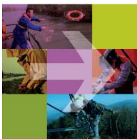
Les équipements de protection individuelle (EPI) Règles d'utilisation

Brochure ED 6077 : Les équipements de protection individuelle (EPI), règles d'utilisation