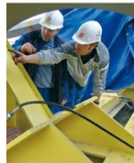
Les casques de protection Choix et utilisation

Brochure ED 993 : les casques de protection