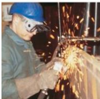
Les équipements de protection individuelle des yeux et du visage

Brochure ED 798 : Les équipements de protection Individuelle des yeux et du visage