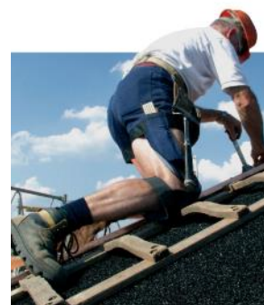
Les articles chaussants de protection Choix et utilisation

Brochure ED 994 : Les articles chaussants de protection