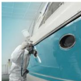
Les appareils de protection respiratoire Choix et utilisation

Brochure ED 6106 : Les appareils de protection respiratoire